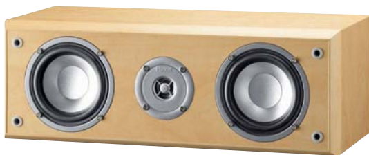
Monitor Center 210